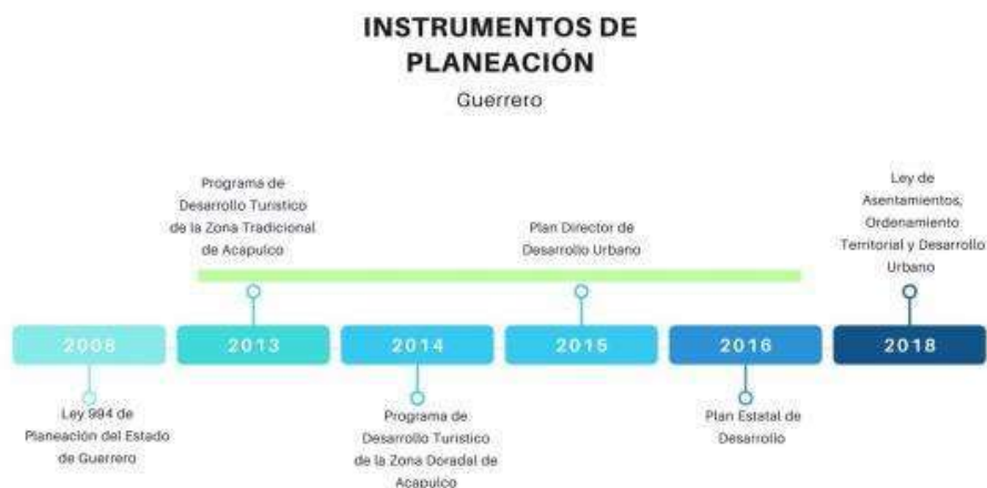
Ilustración 3. Instrumentos de planeación del estado de Guerrero

Sólo se integraron los Programas cuentan con publicación oficial.