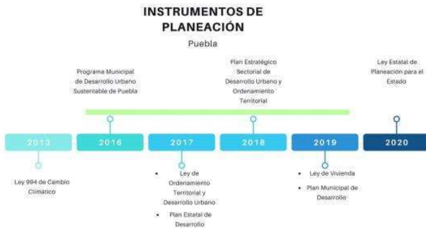
Ilustración 5. Instrumentos de planeación del estado Puebla.

Sólo se integraron los Programas cuentan con publicación oficial.