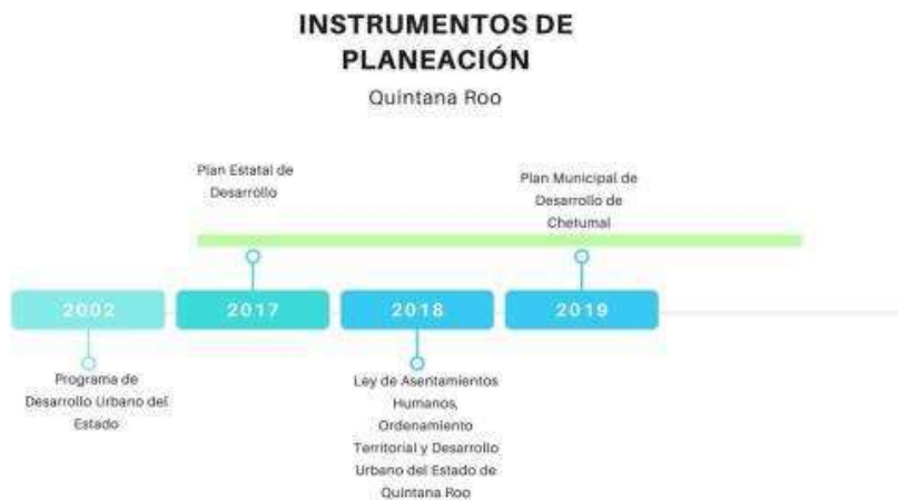
Ilustración 6. Instrumentos de planeación del estado de Quintana Roo

Sólo se integraron los Programas que cuentan con publicación oficial.