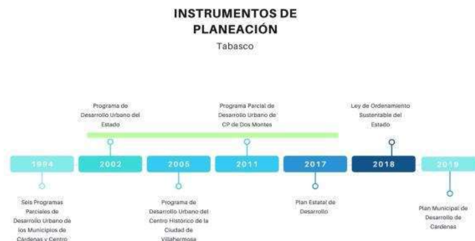
Ilustración 7. Instrumentos de planeación del estado de Tabasco

Sólo se integraron los Programas que cuentan con publicación oficial.