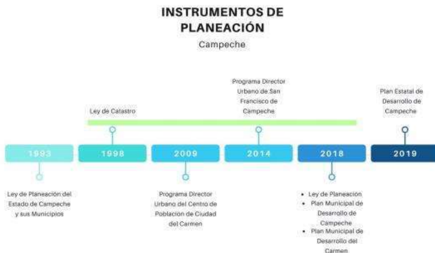
Ilustración 2. Instrumentos de planeación del estado de Campeche

Sólo se integraron los Programas que cuentan con publicación oficial.