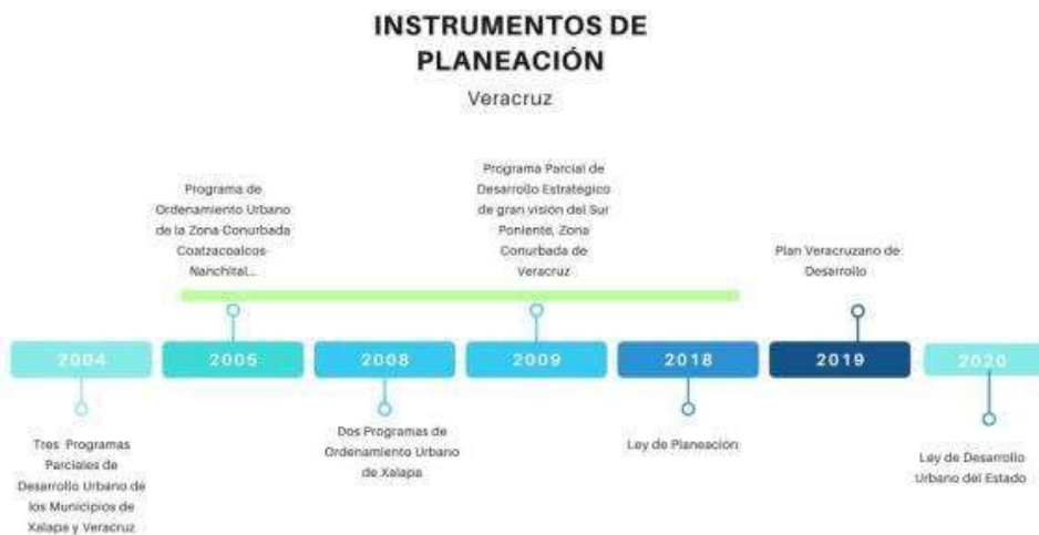
Ilustración 8. Instrumentos de planeación del estado de Veracruz

Sólo se integraron los Programas que cuentan con publicación oficial.