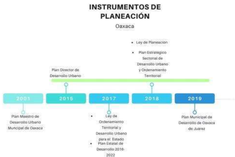
Ilustración 4. Instrumentos de planeación del estado de Oaxaca

Sólo se integraron los Programas cuentan con publicación oficial.