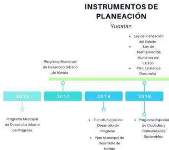
Ilustración 9. Instrumentos de planeación del estado de Yucatán

Sólo se integraron los Programas que cuentan con publicación oficial.