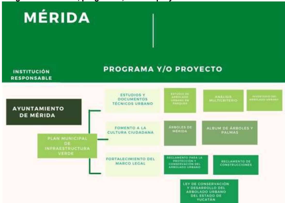
Imagen 3. Iniciativas, programas, obras o proyectos.

En la parte ciudadana existe un Observatorio Urbano que deriva del Programa Municipal de Desarrollo Urbano, donde se discuten temas como Ordenamiento Territorial, Desarrollo Urbano, Vivienda y Sustentabilidad. Lo anterior, es importante señalarlo ya que este Observatorio se encuentra en operación y son pocas las ciudades que actualmente cuentan con esta figura. Además es fácil acceder a sus actividades a través de la página de internet.