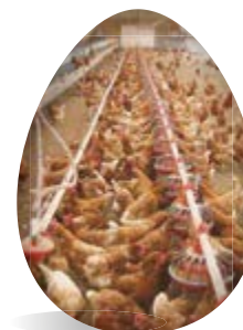
Piso (un nivel)