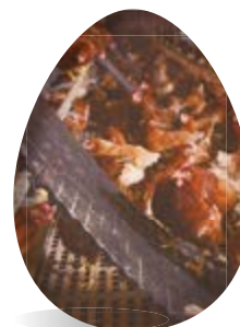
Aviario (varios niveles)